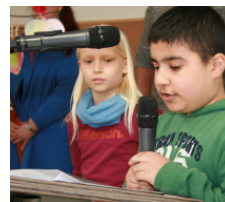
Schulsprecher aus der Primarstufe, die zur Einweihung gratulierten

„...ein Stern der inklusiven Grund- und Gesamtschulen. Die Breite des schulischen Angebotes ist eine Herausforderung, die mit Bravour gelöst wurde.“