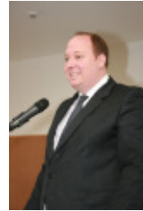
Dr. Helge Braun, Staatsminister im Bundeskanzleramt

„...ein leuchtendes Beispiel für ganz Deutschland.“